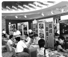
※写真は過去のフェアの様子です。