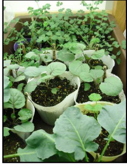
種から育てられた苗たち