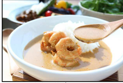
淡路玉葱ビスカカレー

HP: http://www.pasonagroup-challengefarm.jp/