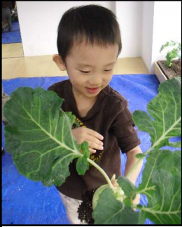
10/19社内保育園の子供たちがコールラビを収穫

10/19、社内保育園の子供たちが7月から育ててきたコールラビの収穫に駆けつけてくれました。「うんとこしょ、どっこいしょ」明るい声がフロアに響き、大きなカブのように成長した苗を小さい体で次々引き抜いていきます。全部で72株。嬉しい花道に収穫された苗たちもどこか誇らしげでした。そして翌日の10/20、7月に計画を始め8月から種を播き準備を進めてきたエディブルガーデンが完成しました！野菜や果樹、ハーブを主体とし、「育てて楽しむ」「食べて楽しむ」のテーマを持つこの庭の様子は近年注目されてきています。ただ、屋外では例があるものの、室内では低照度やプランターの排水問題、植物体ごとに必要とする水量や好む環境の違いもあり、多品種を同じスペースで育成・管理していく事は難しく、とても大きな挑戦でした。今回実現できたのは、この室内環境に合わせて生きようとする逞しい植物たちの力と、アドバイスを下さった識者の皆さまのご協力、そしてチームメンバーの結束があつてのことです。今後も成長する姿を見ていただけるよう精進して参ります。ご来社いただく皆さまには、植物の持つ効能や知られざるパワーをこの場で感じて面白いな、と思っただけなら幸いです。(松本)