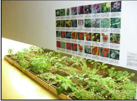
10/20エディブルガーデンが完成！