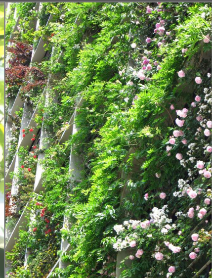
藤の緑の中で映える色とりどりのバラたち