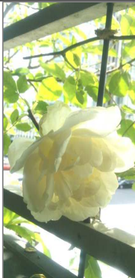
マダム・アルフレッド・キャリエール

今年のバラは皆さんのお越しをつぼみのままでは待ちきれず、花の状態でおめかしして首ではなく茎を長く伸ばしてお待ちしています。アーバンファームで育ったバラの晴れ姿、散ってしまう前に是非その目でご覧ください！(北澤)