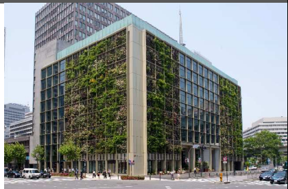
賞をもらってちょっと誇らしげ？